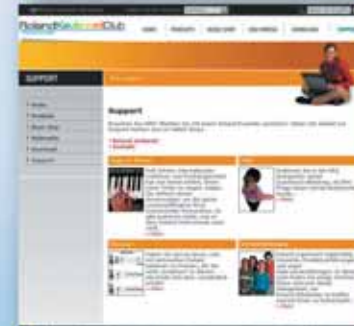
Hier finden Sie Tipps, Tricks und Hilfe zu Ihren Keyboards