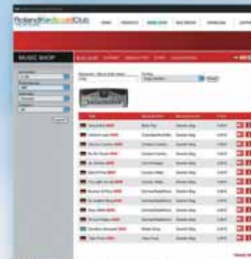
Im Shop finden Sie immer aktuelle Songs und Styles