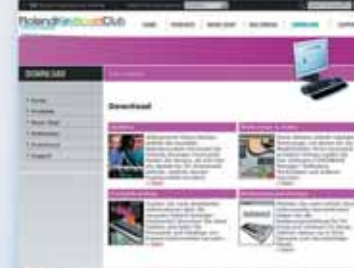
Hier gibt's Updates und nützliche Software