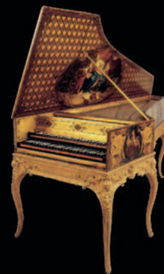
Beispiel eines französischen Cembalos hergestellt 1765 von F. Blanchet.

Das C-30 klingt und sieht nicht nur aus wie ein klassisches Cembalo (Virginal), es spielt sich auch so. Rolands neu entwickelte "Click Action"-Tastatur mit Cembalo-Mensur bietet einen absolut authentischen Cembalo-Anschlag inkl. des typischen "Klick"-Gefühls, wenn die Saite angerissen wird.