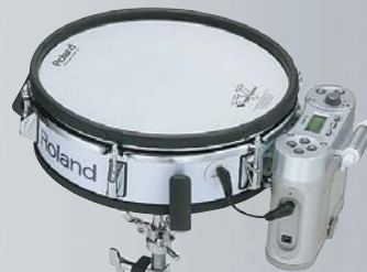
* Snareständer optional.

Dank des geringen Gewichts und des Batteriebetriebs des RMP-12 lässt es sich problemlos längere Zeit tragen. Es kann an handelsüblichen Marsch-Tragegestellen befestigt werden und erlaubt bei drahtloser Übertragung (mit optionalem drahtlosem Übertragungssystem) freie Bewegung beim Spielen. Zum Üben lässt sich das RMP-12 auf einem Standard Snare-Ständer befestigen, wobei sich z.B. ein Roland CUBE Street Amplifier zur Verstärkung empfiehlt. Für geräuschloses Üben lässt sich auch ein Kopfhörer anschließen.