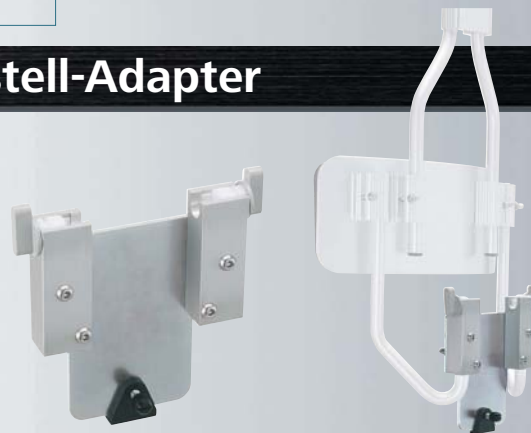
* Marschtrommel-Tragegestell optional.